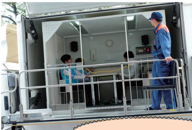
地震体験車が来てくれました！